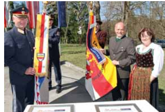
Übergabe der Fahnenbänder