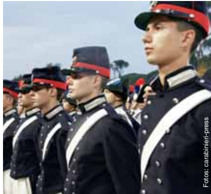
Kadetten in historischen Uniformen