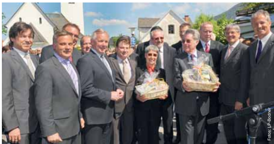
Der Empfang von BP Dr. Heinz Fischer war ungemein herzlich

Als ganz besondere Ehre und Würdigung dieser Initiative kann die Tatsache gewertet werden, dass Bundespräsident Dr. Heinz Fischer mit seiner Gattin der Einladung gefolgt war