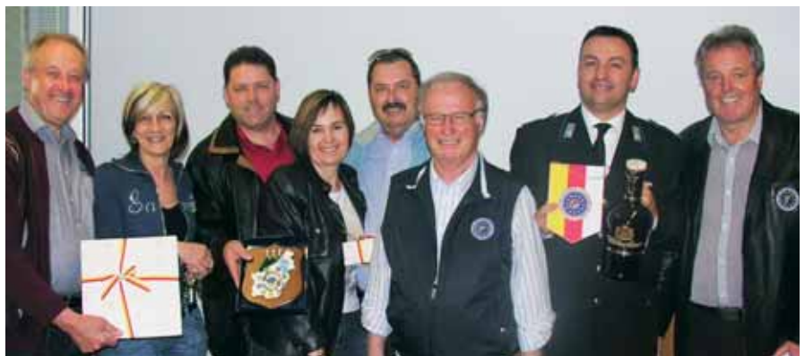
Herzliche Begrüßung im Gendarmeriekommando von San Marino