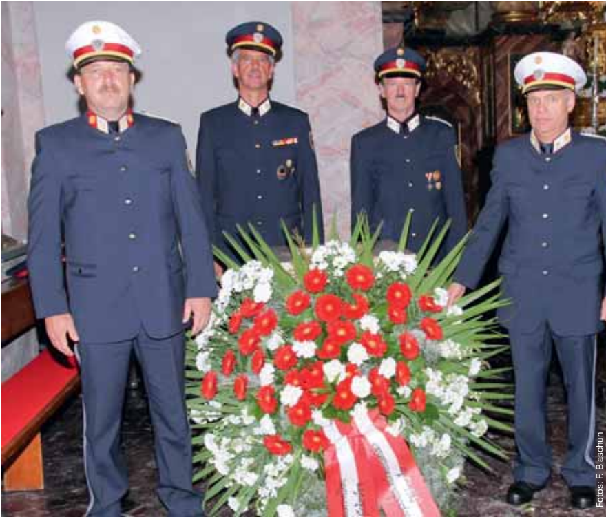
Ein Kranz wurde im Gedenken an die Opfer der gesamten Exekutive niedergelegt