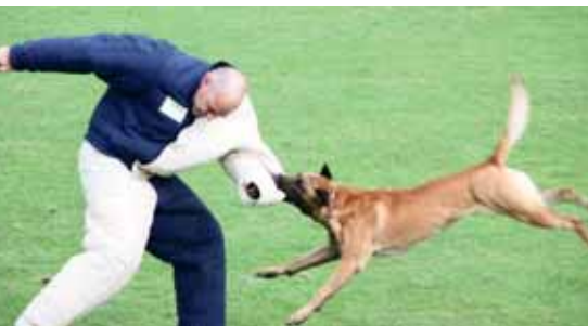
Action pur bei den Vorführungen