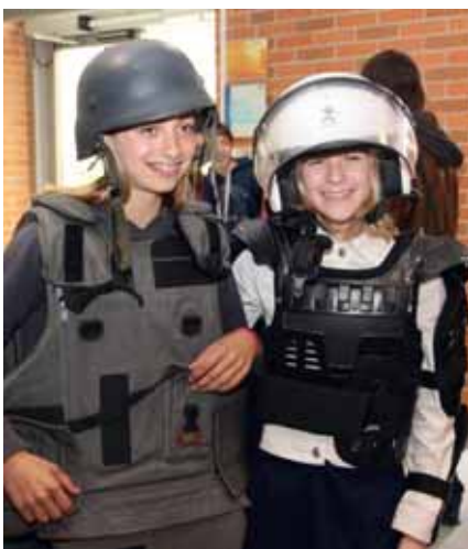
Früh übt sich, wer einmal eine echte Polizistin werden möchte

Dass sie ihren männlichen Kollegen um nichts nachstehen, davon konnten sich die zahlreichen Mädchen, aber auch Schulklassen ein Bild machen. Das Landespolizeikommando hat sich auf diesen Informationstag entsprechend vorbereitet und drei Kolleginnen standen den interessierten Mädchen und Frauen stundenlang Rede und Antwort.