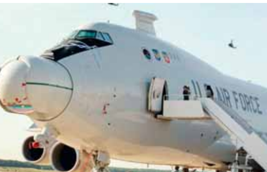
Der Laser an einem Jet der US-Air-Force