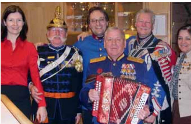
Generalmajor M. Slizki spielte am Abend mit der Harmonika für die Gäste flott auf

Der Kommandant der „Traditionsgendarmerie 1899“, Mjr i.Tr. Ernst Fojan, erläuterte im Zuge des Kongresses die geschichtlichen Hintergründe der österreichischen Gendarmerie, die ja bis 1918 ein integraler Bestandteil des kaiserlichen Heeres gewesen ist. Bei dieser Tagung wurde die Kärntner Gruppe auch zum „Generalrapport“, der heuer im Oktober in Sofia stattfindet, eingeladen.