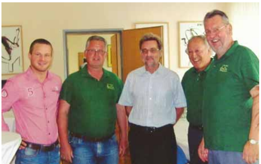
Der Jubilar freut sich mit den Sängern und Gratulanten über die gelungene Überraschung

Auch die Redaktion der POLIZEITUNG schließt sich natürlich den Glückwünschen zum „Runden“ herzlich an!