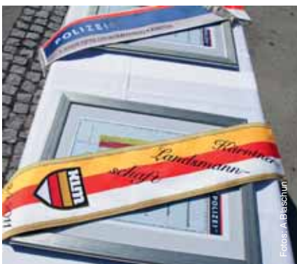
Die neuen Fahnenbänder