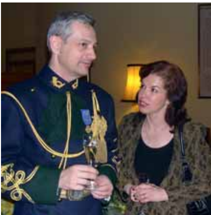
Der Delegierte aus Rumänien mit Gattin

Wie der Präsident der Union, Generalmajor i.TR. Helmut Eberl, bei der Konferenz betonte, sei die Kärntner Gruppe die einzige in Österreich, die in dieser gediegenen Form der ehemaligen Gendarmerie Österreichs, die ja bis 1918 ein bedeutender Teil des kaiserlichen Heeres gewesen ist, damit eine bleibende Referenz erweise und damit versuche, die Tradition des für die Monarchie und Österreich so bedeutenden Korps fortzusetzen und zu pflegen.