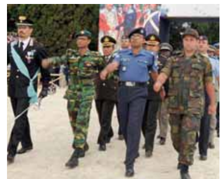
Der Block der Gendarmen-Abordnung aus aller Welt