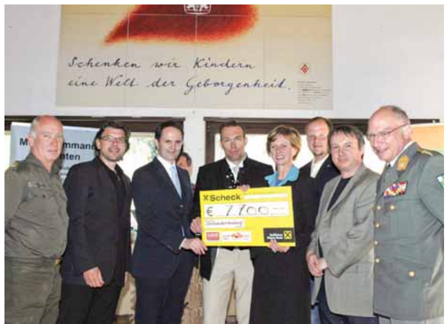
Die Partner übergaben den Reinerlös des heurigen Frühlingskonzertes an die Leiterin des SOS-Kinderdorfes.

deren Unterstützung die Benefizkonzerte seit 30 Jahren veranstaltet werden können. □