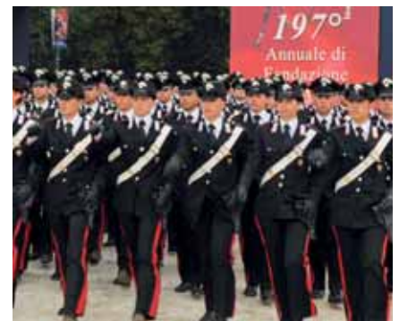
Moderne Carabinieri in Patrouillenadjustierung