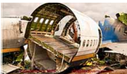
Die Maschine wurde 2002 aus dem Verkehr genommen und verschrottet.

Zuerst wurde angenommen, dass es sich um Zigarettenrauch handelte; als dieser jedoch dichter wurde, reagierten die Passagiere alarmiert. Passagiere, die aus einem Fenster schauen konnten, bemerkten schließlich, dass die Triebwerke ungewöhnlich hell erschienen, als ob etwas durch die Blätter der Lüfter hindurch leuchten würde.