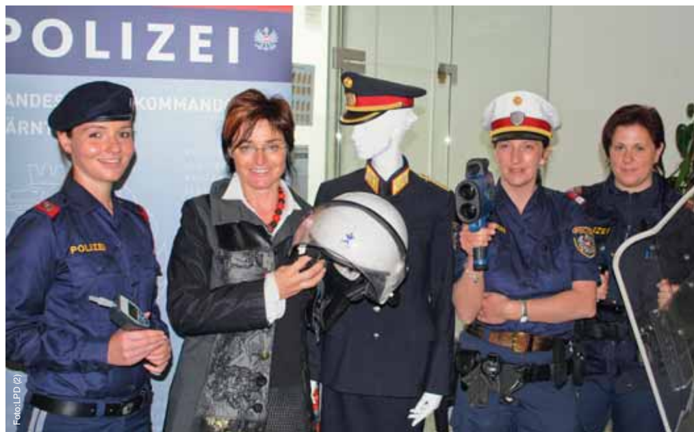
Landesrätin Prettner mit den Kolleginnen beim Girl's Day 2011 im LPK

Prettner, die in dieser Berufssparte für Frauen eine große Chance sieht, sicherte zu, sich beim Bundesministerium für Inneres für weitere Ausbildungslehrgänge in Kärnten stark zu machen. „Kärnten braucht eine personell gut aufgestellte Exekutive und dabei vor allem auch Frauenpower im Polizeidienst“, so Prettner.