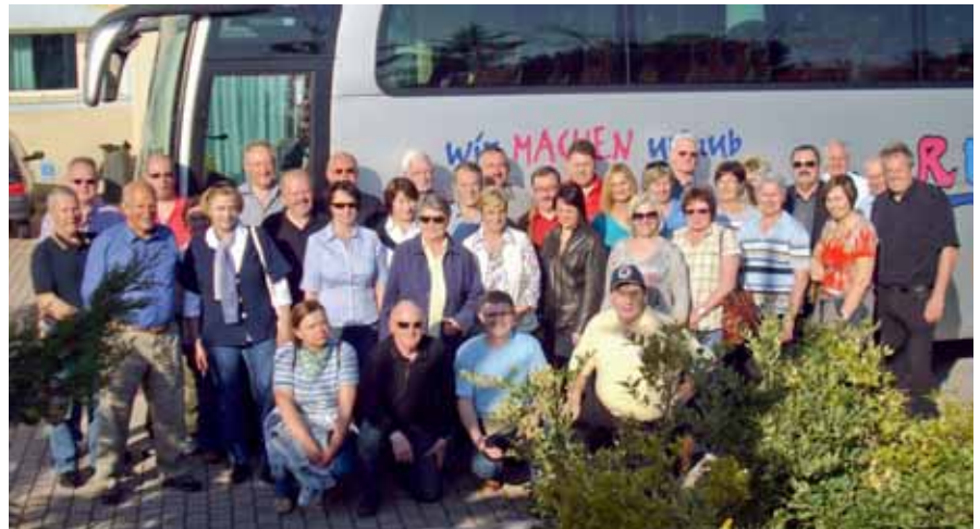
Vor der Abreise