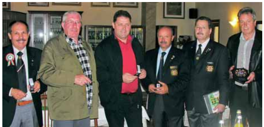
Frühstück in Padua mit Freunden der Polizei von Padua