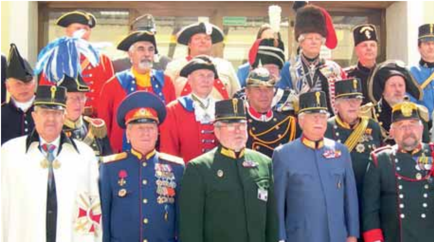
Gruppenbild der Teilnehmer am Kongress

Die von der Gesellschaft der Gendarmerie- und Polizeifreunde Kärnten im Vorjahr ins Leben gerufene „Kärntner „K.u.k. Traditionsgendarmerie 1899“ wurde beim diesjährigen turnusmäßigen Kongress der Union der