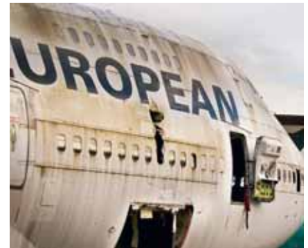
So arg ramponiert sah die Maschine außen nach dem Flug bzw. der Landung in Djakarta aus.

Der Pilot erklärte für den Flug eine Luftnotlage bei der zuständigen Flugsicherung. Inhalt der Nachricht war, dass alle vier Triebwerke ausgefallen seien. Jakarta Area Control verstand die Nachricht aber falsch, und sie vermeinten, nur Triebwerk 4 sei ausgefallen. Der Verlust aller Triebwerke war von den Passagieren nicht unbemerkt geblieben. Während einige resignierten und sich dem Schicksal ergaben, schrieben andere Briefe an ihre Angehörigen. Bemerkenswerterweise gab es jedoch kaum Panik, selbst nachdem später der Kabinendruck aufgrund der ausgefallenen Triebwerke absank und die Sauerstoffmasken von der Decke fielen. Die Crew der Boeing versuchte, die Fluglotsen in Jakarta zu erreichen, um eine Radarführung zu erhalten. Der Tower in Jakarta konnte die Boeing jedoch nicht orten, obwohl diese zwischenzeitlich den Transpondercode „7700 – Luftnotfall (emergency)“ eingeschaltet hatte. Trotz der großen Anspannung und des Zeitdrucks gelang es dem Kapitän, eine Ansage zu machen, die als eine Meisterleistung der Untertreibung in