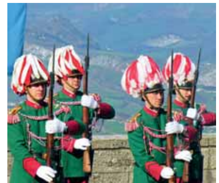
Ein buntes Bild boten die ausgerückten Traditionsverbände der Zwergrepublik