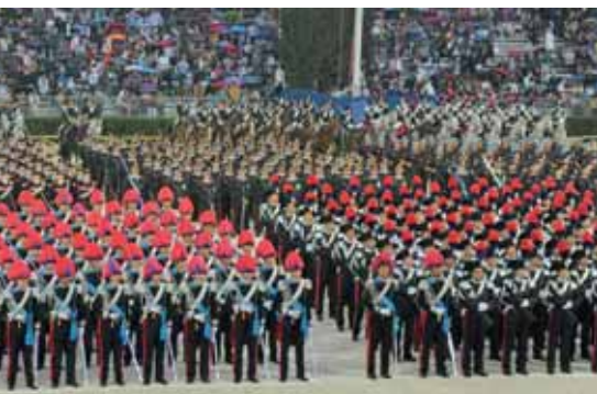
Blick auf den Paradeplatz