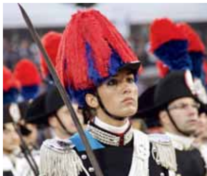
Der Gender-Mainstream macht auch vor den Carabinieri nicht halt