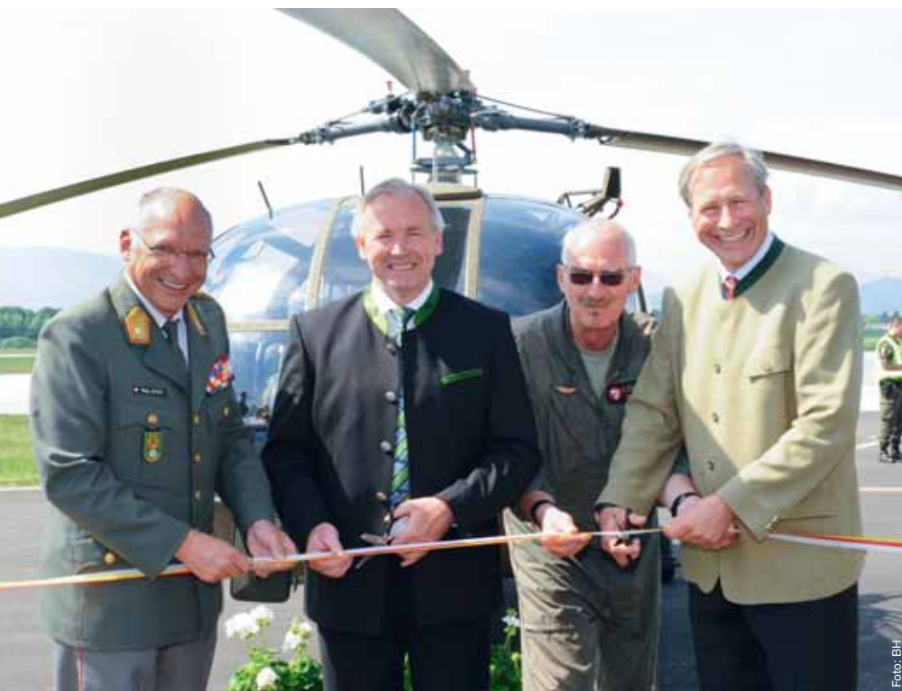
Eröffnung des neu adaptierten Stützpunktes in Annabichl

onsthema geworden sei. Diese unerträgliche Verunsicherung der Bevölkerung und Soldaten sei sofort zu beenden. Das Bundesheer begleite die Republik von Anfang an, durch seine Friedenseinsätze im In- und Ausland habe Österreich an Ansehen gewonnen. Dörfler ist sich auch sicher, dass die Österreicher zur Wehrpflicht stehen.