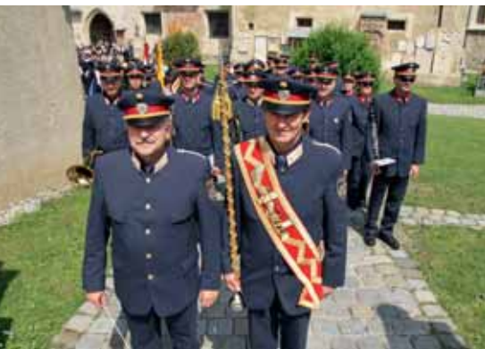
Die Polizeimusik spielte zünftig auf