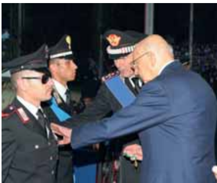
Präsident Napolitano bei der Ehrung der Carabinieri-Helden