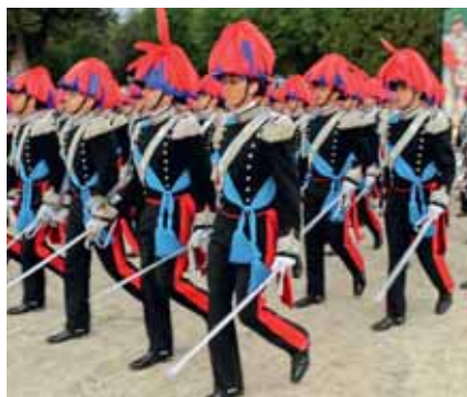
Ein Block der Traditionseinheiten