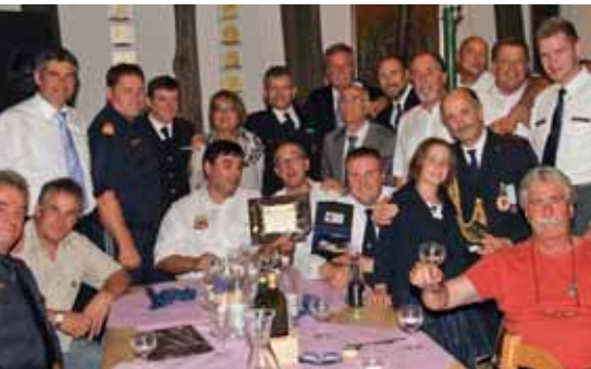
Die Freunde aus Kärnten, Slowenien und Triest beim gemeinsamen Abendessen in Miramare