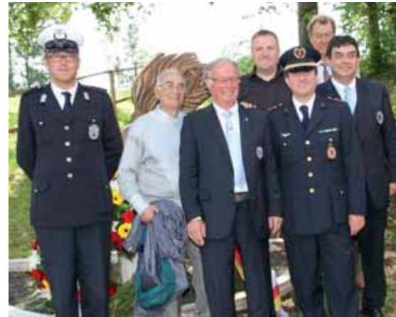
Die treuen Freunde aus Italien waren auch heuer wieder gekommen.

LPKdt Generalmajor Wolfgang Rauegger verwies in seiner Grußadresse auf die nunmehr sehr breite und sehr gute Kooperation mit der Gesellschaft der Gendarmerie- und Polizeifreunde, die am 2. Juli im Rahmen des Polizeitraditionstages in Velden durch eine Fahnenbandübergabe dokumentiert wird. Der 2. Landtagspräsident Rudolf Schober betonte in seiner Grußadresse die große Genugtuung, dass es mit vereinten Kräften doch noch gelungen sei, den Kärntner Kirchtag und diese Gedenkfeier sozusagen am Leben zu erhalten. Als ehemaligen Gendarmen freue es ihn auch ganz besonders, dass mit der „K.u.k. Traditionsgendarmerie 1899“ hier ein so bedeutender und nachhaltiger Impuls für echte Traditionspflege gesetzt wurde.