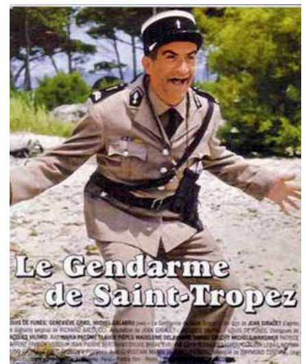
Plakat eines der legendären Filme mit dem quirligen und chaotischen Gendarmen Luis de Funès (alias Ludovico Chrucho)