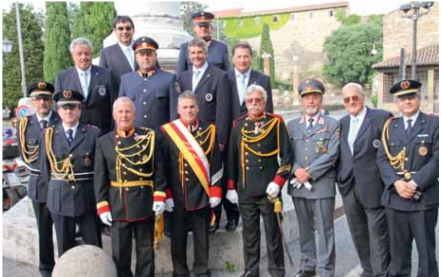
Die Delegation mit den italienischen Freunden vor der Burg San Giusto

An einem der sicherlich schönsten Plätze der ehemaligen K.u.k.-Hafenstadt Triest, der Bastion San Giusto, wurde am Abend des 15. Juni 2009 in einer feierlichen Zeremonie des 149. Gründungstages der Polizia Municipale gedacht. Eine besondere Freude war es für unsere Gesellschaft, dass auch heuer wieder eine Vorstands- und Präsidiumsdelegation der Gendarme-