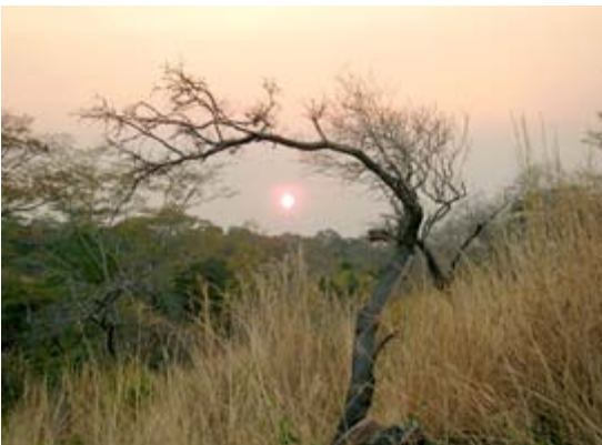
Die Sonnenuntergänge entschädigten für manche Unbill bei diesem Einsatz

Sambia liegt im südlichen Afrika, ist in etwa so groß wie Deutschland und Frankreich zusammen und ist trotzdem, wie so viele andere afrikanische Länder auch, nur ein Popanz, eine graue Eminenz unter den Staaten. Ich hatte das Glück, als einer von drei Auslandsdienstern dort arbeiten zu dürfen. Wie man zu einem Auslandszivildienst kommt, sei kurz erklärt. In Österreich hat man die Möglichkeit zwischen Präsenzdienst oder Zivildienst zu wählen. Entscheidet man sich für den Zivildienst, hat man die Möglichkeit, diesen in einem geeigneten Projekt im Ausland abzuleisten. Der Einsatz dauert 14 Monate und ist unentgeltlich. Flug, Aufenthaltsgenehmigung, Impfungen, Vorbereitungskurse, Kost und Unterkunft im Einsatzland werden jedoch bezahlt. Vom Innenministerium wird diese Arbeit als Ersatzdienst für den ordentlichen Zivildienst anerkannt. Der Weg dorthin beginnt mit dem Einreichen einer Zivildiensterklärung bis längstens zwei Tage