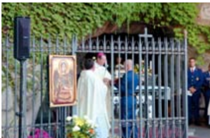
Messfeier in den Vatikanischen Gärten