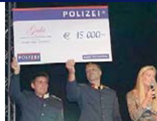
Freudig wurde der symbolische Scheck bei der Gala gezeigt