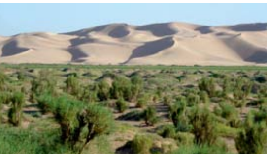
Die Wüste Gobi - ein Abenteuer für jedermann