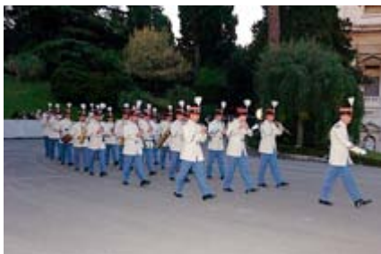
Die Musikkapelle der „Lancieri di Montebello“ (italienisches Heer)

Erstmals seit dem Jahr 1970 fand im Vatikan wieder eine Vereidigung von neuen Mitgliedern des päpstlichen Gendarmekorps statt. Anlässlich des Festes des heiligen Erzengels Michael, des Schutzpatrons der vatikanischen Gendarmerie, feierte Erzbischof Giovanni Lajolo, der Präsident des Governatorates des Staates der Vatikanstadt, am 30. September mit den Gendarmen und deren Angehörigen vor der Lourdesgrotte in den Vatikanischen Gärten eine heilige Messe. Im Anschluss an den Gottesdienst zogen die Gendarmen in einem feierlichen Marsch vor den Palazzo del Governatorato (Governorenpalast). Ihnen voran wurde die gelbweiße Flagge des Vatikanstaates getragen. Die musikalische Begleitung besorgte die Kapelle der „Lancieri di Mon-