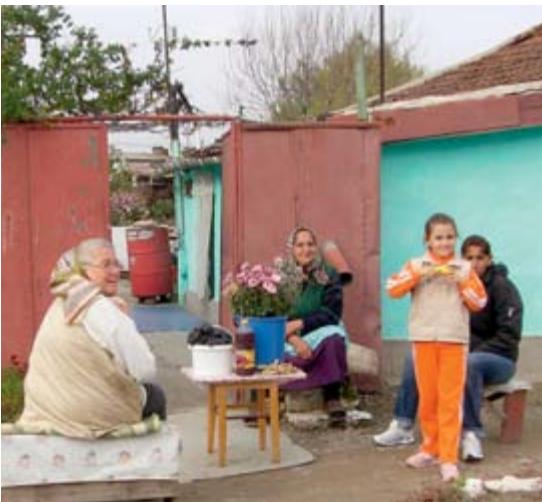
Armut pur im Gegensatz

war, nur unsere Namen lesen konnten. Die Kollegen übersetzten aber den für uns und die österreichische Polizei sehr positiv gehaltenen Artikel über die vortägige Pressekonferenz. In den beiden noch verbleibenden Tagen durchkreuzten wir im Streifenwagen, mit Dolmetscher und Reiseführer, Land und Stadt, wo uns einige Erlebnisse und Sehenswürdigkeiten geboten wurden. Auch ein ausgedehnter Jagdausflug in die dortigen Reviere durfte für die beiden passionierten Jäger nicht fehlen.