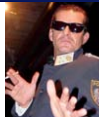
Auch ein Falco-Imitator trat als „Kommissar“ auf