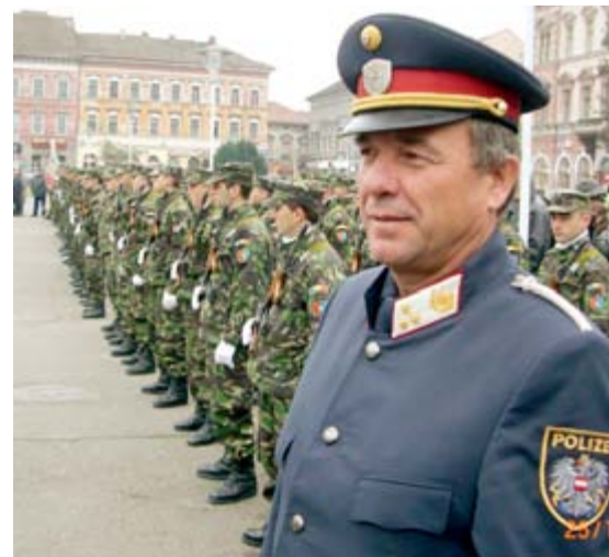
Der Autor im Vordergrund beim großen Festakt

Nach dem Eintreffen am späten Abend und einem ausgesprochen herzlichen Empfang, wurden die Kärntner Polizisten in einem Vier-Sterne-Hotel einquartiert und zu einem ausgedehnten Dinner eingeladen. Für den nächsten Tag wurde bereits ein Treffen (relativ früh am Morgen) vereinbart: Termin beim Polizeichef von Arad, welcher wiederum einen großen Teil seiner Mitarbeiter vorstellte. Darauf folgte dann gemeinsam mit dem Polizeichef die Teilnahme an der Gründungsfeier des rumänischen Militärs mit Kranzniederlegung und Festakt vor dem Denkmal. Nach einem feudalen Mittagessen fand eine Pressekonferenz statt, in der den rumänischen Kollegen die neuen österreichischen Polizeistrukturen vorgestellt wurden. Diese Ausführungen fanden großes Echo, gibt es doch im Gegensatz zu Rumänien gravierende Unterschiede. Von aufmerksamen Zuhörern wurden an die Gäste aus Kärnten immer wieder sach-