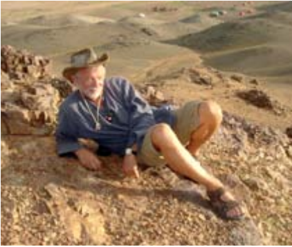
Auch eine Rast auf Steinen kann „erholsam“ sein

Die Mongolei, mein Hauptreiseziel, ist übrigens viermal so groß wie Deutschland und hat ca. 2,5 Mio. Einwohner, wovon 1 Mio. in der Hauptstadt Ulan Bator lebt. Bevölkerungsdichte 1,6 Ew./km 2 .