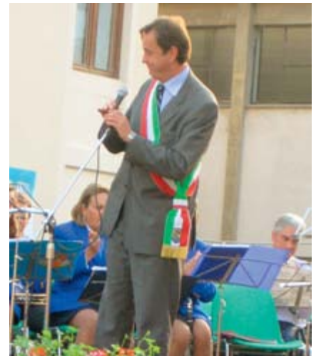
Ansprache des Bürgermeisters von Tarvis

Mit dem Austausch von Gastgeschenken im Kulturzentrum Tarvis endete diese wirklich toll organisierte Jubiläumsveranstaltung.