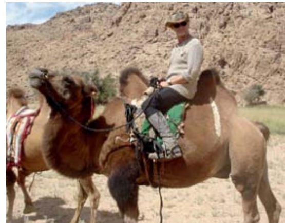
Die Ritte auf den „Wüstenschiffen“ waren nicht immer leicht zu bewältigen