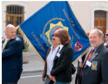
Beginn des Festzuges