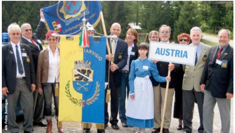
Die Kärntner Delegation in Tarvis

Der lokale Vorstand der italienischen Sektion hatte ein vielfältiges Programm erstellt, das spätsommerliche Schönwetter und der Reiz der weit über die Grenzen hinaus bekannten, traditionellen Einkaufsstadt Tarvis taten ihr Übriges dazu, um IPA-Freunde aus insgesamt fünf Nationen zu unseren südlichen Nachbarn zu locken. Als Gratulanten nach Tarvis gekommen waren neben der Kärntner Delegation, IPA-Freunde aus Deutschland, Slowenien, Frankreich und Belgien. Am frühen Vormittag ging es in das alte Bergbaudorf Raibl, wo im dortigen Kriegs- und Bergbaumuseum Relikte der Vergangenheit besichtigt wurden. Ein Besuch der alten Bergbaustollen, wo Blei und Zink abgebaut wurden, rundete den interessanten Ausflug ab. Zu Mittag erfolgte der Aufmarsch zum Festumzug. Mit Cheerleaderbegleitung ging es auf der Hauptstraße in Tarvis zum Sportzentrum. Um 18:00 Uhr begann auf der Piazza Unita der Festakt. Grußworte überbrachten die Präsidenten der Lokalen Vorstände, der Bürgermeister von Tarvis, der Regionalpräsident und der Nationalpräsident der IPA. Den krönenden Abschluss des sehr gelungenen Programms bildete der Auftritt je einer Gesangsgruppe aus Italien und Slowenien sowie eines Kärntner Männerchors.