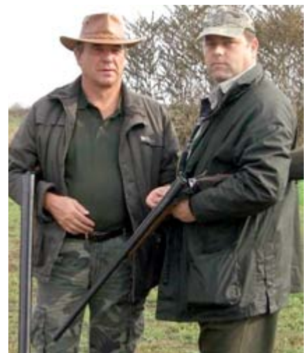
Die „zwei Kärntner Großwildjäger“ vor der Einladungspirsch in den Wäldern „Draculas“

bezogene Fragen gestellt und auch beantwortet. Weitere Besuchspunkte waren die Verkehrs- und Kriminalabteilung und ein Anhaltezentrum für Schubhäftlinge, das von der Grenzpolizei selbst verwaltet wird. Am zweiten Tag des Aufenthaltes wurde uns als erstes beim gemeinsamen Frühstück die rumänische Tageszeitung präsentiert, in der wir, weil sie natürlich in rumänisch geschrieben