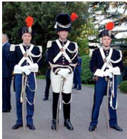
Die Gendarmen in ihrer Galauniform