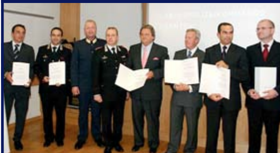
Ein Teil der Geehrten - hier die italienischen Fahnder

Aus Anlass der Zerschlagung der so genannten „Bankomatsprengerbande“, wurden am 1. Oktober 2007 die Mitglieder der Sonderkommission vom Bundeskriminalamt bzw. vom Landespolizeikommandanten geehrt. Durch die hervorragenden Kooperation von italienischen, kroatischen