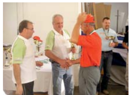
Die Goldmedaillen werden einen Ehrenplatz bekommen

Zusätzlich gab es noch eine eigene Wertung der steirischen Teilnehmer, in der ebenfalls Bergner ganz vorne stand. Gratulation zu dieser hervorragenden Leistung. -red-