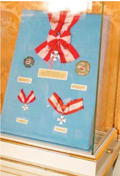
Insignien der Milak im Prunksaal