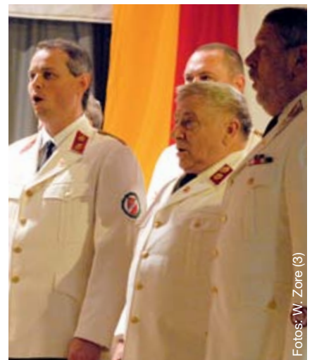
... aus voller Kehle