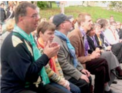
„Full-House“ in Pflausach beim großen Fest