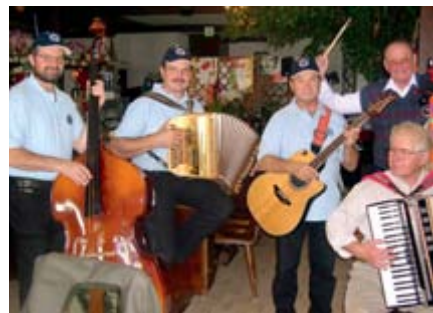
„Die drei Zweinitzer“ machten der Hausmusik ordentlich Konkurrenz