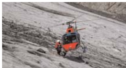
Die Polizei-Hubschrauber bei der Bergung

Gletschereis können die übrigen nicht halten, und so stürzen alle fünf Bergsteiger sich mehrmals überschlagend über die steile Flanke ab. Zeugen beobachten wie sie verzweifelt versuchen, die Pickel in das blanke Eis zu rammen, jedoch vergeblich. Nach ca. 60 m Absturz mit hoher Geschwindigkeit fängt eine ca. ein Meter tiefe Querspalte die Stürzenden auf. Beide Männer erleiden dabei schwerste Kopfverletzungen und sind auf der Stelle tot, die drei Frauen sind zum Teil lebensgefährlich verletzt. Nun läuft eine der größten Bergungsaktionen am Großglockner an. Begünstigt durch das schöne Wetter, können Hubschrauber starten. Insgesamt drei Rettungshubschrauber, ALPIN HELI 6 aus Zell am See, MARTIN I aus St. Johann i.Pg. sowie CHRISTOPHORUS 7 aus Lienz, bringen die Verletzten in die Krankenhäuser UKH Salzburg, KH Schwarzach bzw. BKH Lienz. Allein die medizinische Versorgung und Bergung am steilen Gletscher stellt an Notärzte und Flugretter höchste Anforderungen. Die Leichen werden später vom Polizeihubschrauber des BM.I geborgen. Im Anschluss er-