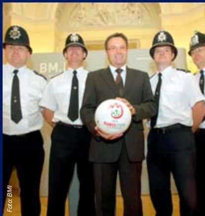
Minister Platter begrüßte die englischen Kollegen in der Herrengasse

Vier uniformierte englische Polizeibeamte unterstützten am 16. November 2007 beim freundschaftlichen Länderspiel Österreich - England die Wiener Polizei. Die britischen Polizisten agierten im Vorfeld des Freundschaftsspiels im Wiener Ernst-Happel-Stadion. Hauptaufgabe war unter anderem, die Empfangnahme jener englischen Fans, die mit dem Flugzeug via Schwechat zum Spiel anreisen. Innenminister Günther Platter begrüßte die Beamten persönlich am 15. November 2007 im Innenministerium. Neben diesen vier uniformierten Polizisten, waren auch sieben so genannte „Spotters“ - szenekundige Beamte - im Einsatz. Diese „Aufklärer“ in Zivil bewegen sich im Vorfeld unter den Fans und sollen jede risikoverdächtige Entwicklung sofort erkennen.