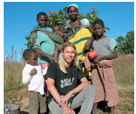
Besuch einer Familie im Busch

oft Schwierigkeiten. Wir stellten jedoch schnell fest, dass es nicht darum ging, alles zu wissen oder sofort zu können, sondern an ein Problem konsequent heranzugehen, nach einer Lösung zu suchen und die Fähigkeit zu haben, Wissen sozusagen „on demand“ anzueignen.