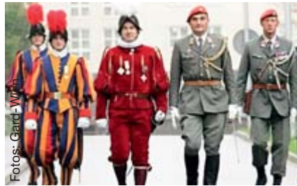
Vor dem Auftritt am Nationalfeiertag wurde noch fleißig trainiert