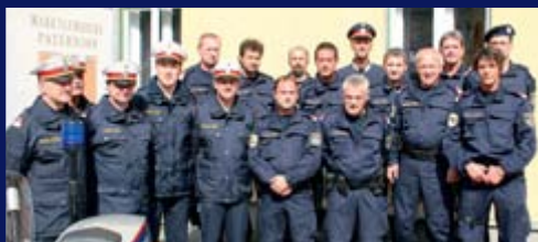
Die Mannschaft der PI Paternion beim Festtag