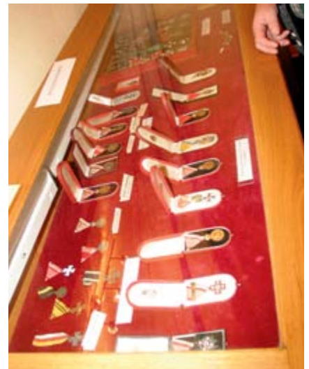
Im Museum: Ein Teil der Orden der k.u.k. Armee

Nach dem Anschluss wurde an der Wiener Neustädter Burg eine Kriegsschule für die Unteroffiziersausbildung eingerichtet die zu Beginn von Erwin Rommel geleitet wurde. In dieser Zeit wurde die Anlage auch um die heutige Daun Kaserne erweitert die heute das BORG (Bundesoberstufenrealgymnasium), das Militärrealgymnasium (MilRG) und das BRGfB (Bundesrealgymnasium für Berufstätige Zeitsoldaten) beherbergt. Nach der Gründung des Bundesheeres im Jahr 1955 war die Militärakademie nochmals bis 1958 in Enns untergebracht, von wo sie anschließend wieder in die Burg von Wiener Neustadt übersiedelte, nachdem die Beschädigungen durch den Zweiten Weltkrieg behoben wurden. Seit 1997 betreibt die Militärakademie auch Fachhochschulstudiengänge und kann auch von Zivilisten besucht werden. Im Abschlussjahrgang 2003 schlossen die ersten vier Frauen die Ausbildung an der Militärakademie positiv ab. Insgesamt wurden 3.576 Offiziere an der Theresianischen Militärakademie seit ihrer Wiedereröffnung im Jahr 1959 ausgebildet. Es gibt zwei Studentenverbindungen als Hausverbindungen an der TherMilAk: Die „Österreichische katholische akademische Verbindung THERESIANA“ und die „Akademische Tafelrunde WIKING zu WIENER NEUSTADT“. Absolventen der Theresianischen Militärakademie können auch dem Absolventenverein Alt-Neustadt beitreten. r.h.-