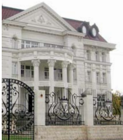
Eines der pompösen Häuser der Roma-Bosse

war, nur unsere Namen lesen konnten. Die Kollegen übersetzten aber den für uns und die österreichische Polizei sehr positiv gehaltenen Artikel über die vortägige Pressekonferenz. In den beiden noch verbleibenden Tagen durchkreuzten wir im Streifenwagen, mit Dolmetscher und Reiseführer, Land und Stadt, wo uns einige Erlebnisse und Sehenswürdigkeiten geboten wurden. Auch ein ausgedehnter Jagdausflug in die dortigen Reviere durfte für die beiden passionierten Jäger nicht fehlen.