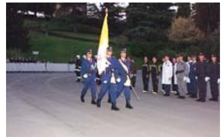
Die Fahne des Vatikanstaates ging voraus