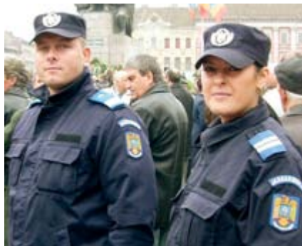
Zwei Angehörige der Rumänischen Gendarmerie

Nach dem Eintreffen am späten Abend und einem ausgesprochen herzlichen Empfang, wurden die Kärntner Polizisten in einem Vier-Sterne-Hotel einquartiert und zu einem ausgedehnten Dinner eingeladen. Für den nächsten Tag wurde bereits ein Treffen (relativ früh am Morgen) vereinbart: Termin beim Polizeichef von Arad, welcher wiederum einen großen Teil seiner Mitarbeiter vorstellte. Darauf folgte dann gemeinsam mit dem Polizeichef die Teilnahme an der Gründungsfeier des rumänischen Militärs mit Kranzniederlegung und Festakt vor dem Denkmal. Nach einem feudalen Mittagessen fand eine Pressekonferenz statt, in der den rumänischen Kollegen die neuen österreichischen Polizeistrukturen vorgestellt wurden. Diese Ausführungen fanden großes Echo, gibt es doch im Gegensatz zu Rumänien gravierende Unterschiede. Von aufmerksamen Zuhörern wurden an die Gäste aus Kärnten immer wieder sach-