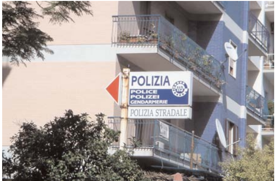
Die „mehrsprachige“ Polzeitafer von Sorent

Eine nette Geste - wäre doch eine Idee für Österreich, wo doch 156 Jahre die Gendarmerie existiert hat, oder?