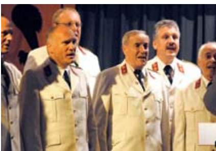
Erfolgreicher Auftritt zum 25. Geburtstag