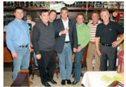
Im Weingut Pasler war gute Laune Trumpf

Nach dem Anschluss wurde an der Wiener Neustädter Burg eine Kriegsschule für die Unteroffiziersausbildung eingerichtet die zu Beginn von Erwin Rommel geleitet wurde. In dieser Zeit wurde die Anlage auch um die heutige Daun Kaserne erweitert die heute das BORG (Bundesoberstufenrealgymnasium), das Militärrealgymnasium (MilRG) und das BRGfB (Bundesrealgymnasium für Berufstätige Zeitsoldaten) beherbergt. Nach der Gründung des Bundesheeres im Jahr 1955 war die Militärakademie nochmals bis 1958 in Enns untergebracht, von wo sie anschließend wieder in die Burg von Wiener Neustadt übersiedelte, nachdem die Beschädigungen durch den Zweiten Weltkrieg behoben wurden. Seit 1997 betreibt die Militärakademie auch Fachhochschulstudiengänge und kann auch von Zivilisten besucht werden. Im Abschlussjahrgang 2003 schlossen die ersten vier Frauen die Ausbildung an der Militärakademie positiv ab. Insgesamt wurden 3.576 Offiziere an der Theresianischen Militärakademie seit ihrer Wiedereröffnung im Jahr 1959 ausgebildet. Es gibt zwei Studentenverbindungen als Hausverbindungen an der TherMilAk: Die „Österreichische katholische akademische Verbindung THERESIANA“ und die „Akademische Tafelrunde WIKING zu WIENER NEUSTADT“. Absolventen der Theresianischen Militärakademie können auch dem Absolventenverein Alt-Neustadt beitreten. r.h.-