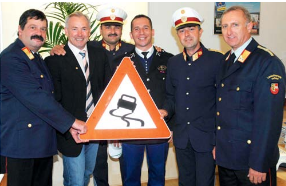
Auch der Tag der offenen Tür beim Land Kärnten stand auf dem Programm für den französischen Gendarmerieoffizier