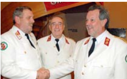
Die Spitzen des Chores freuen sich über ein Vierteljahrhundert

Am 6. Oktober 2007 feierte der Polizeichor Villach mit einem Festkonzert sein 25-jähriges Bestandsjubiläum.