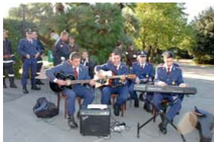
Junge Gendarmen übernehmen die musikalische Gestaltung der Messe