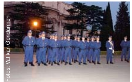
Die neu vereidigten Gendarmen