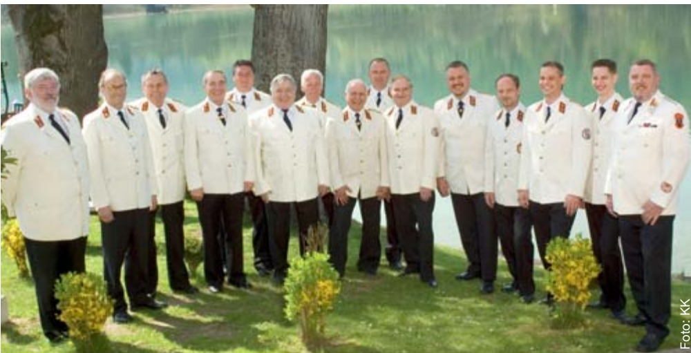
Der jublierende Chor